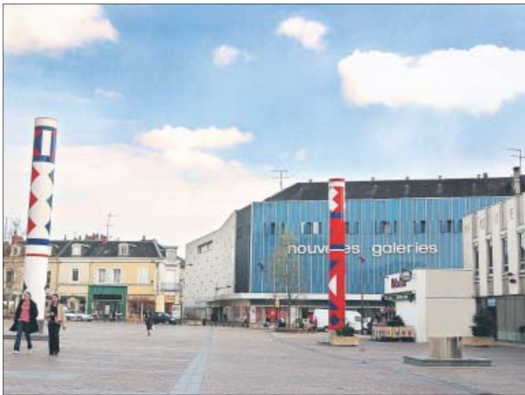
Les colonnes de Rougemont se sont à nouveau invitées dans le débat.